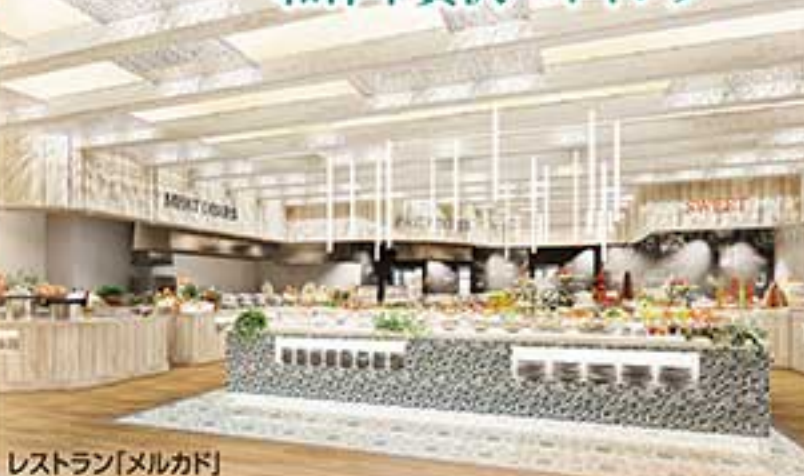
レストラン「メルカド」