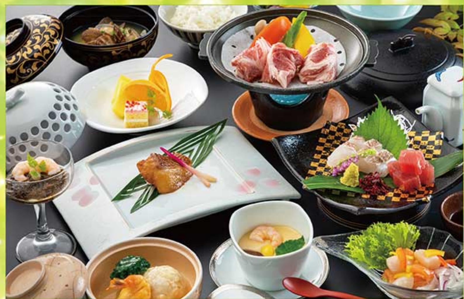
※料理写真はイメージです。