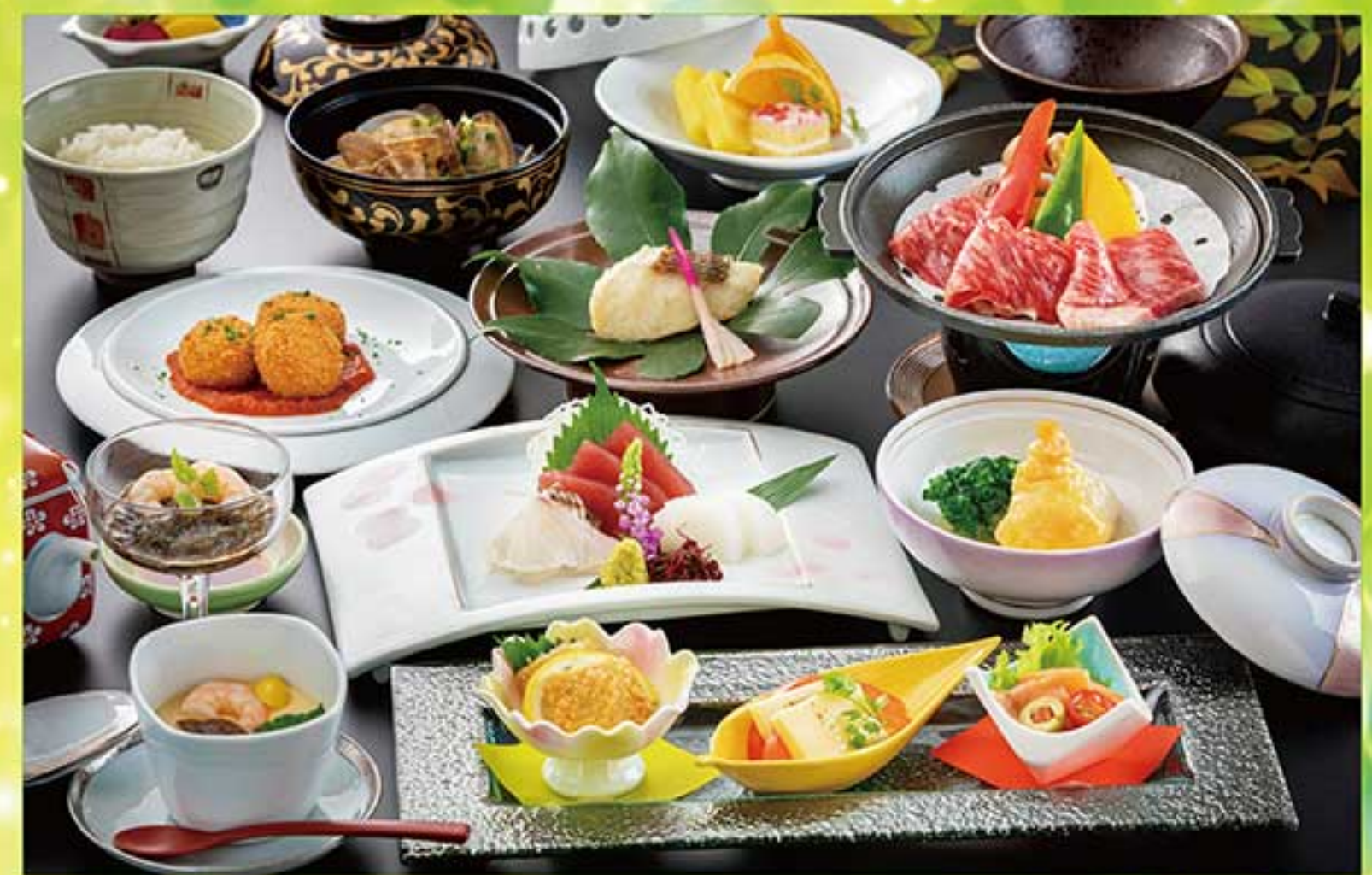
※料理写真はイメージです。