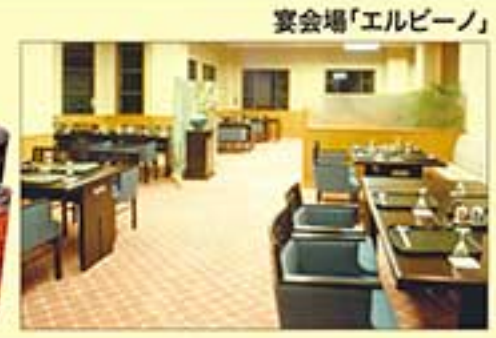
宴会場「エルビーノ」